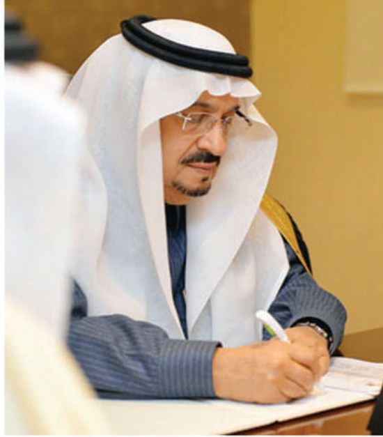
صاحب السمو الملكي الأمير فيصل بن بندر بن عبدالعزيز آل سعود أمير منطقة الرياض رئيس مجلس إدارة جمعية البر بالرياض