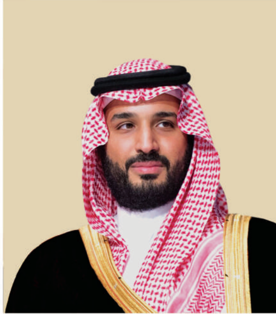
صاحب السمو الملكي الأمير محمد بن سلمان بن عبد العزيز آل سعود ولي العهد نائب رئيس مجلس الوزراء ووزير الدفاع