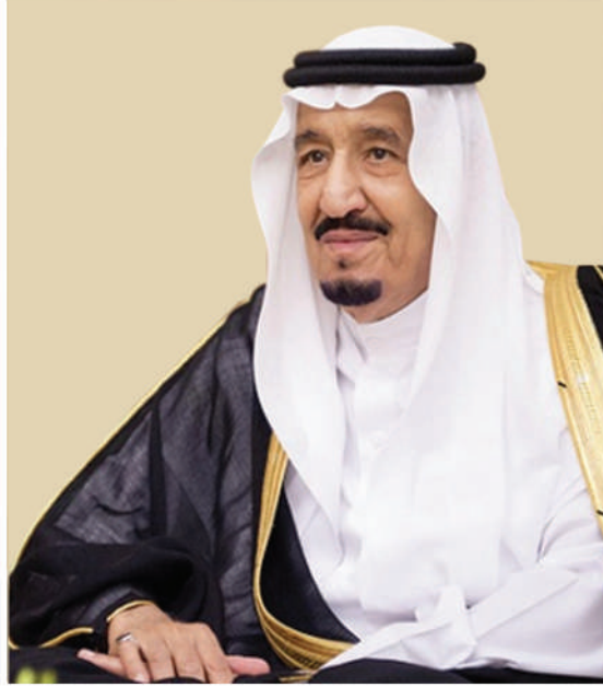
خادم الحرمين الشريفين الملك سلمان بن عبدالعزيز آل سعود